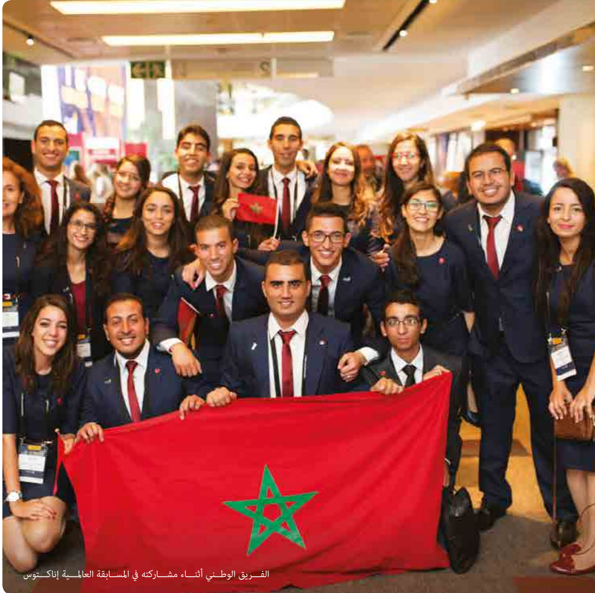
الفريق الوطني أثناء مشاركته في المسابقة العالمية إناكتوس