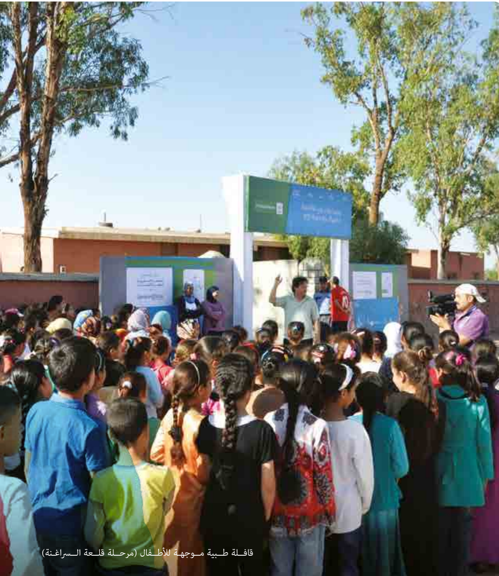
قافلة طبية موجهة للأطفال (مرحلة قلعة السراغنة)

أنجزت مؤسسة OCP عدة أنشطة في مجالي التكوين ومواكبة الجمعيات بهدف تنمية كفاءاتهم في هندسة المشاريع والحكامة الجمعوية.