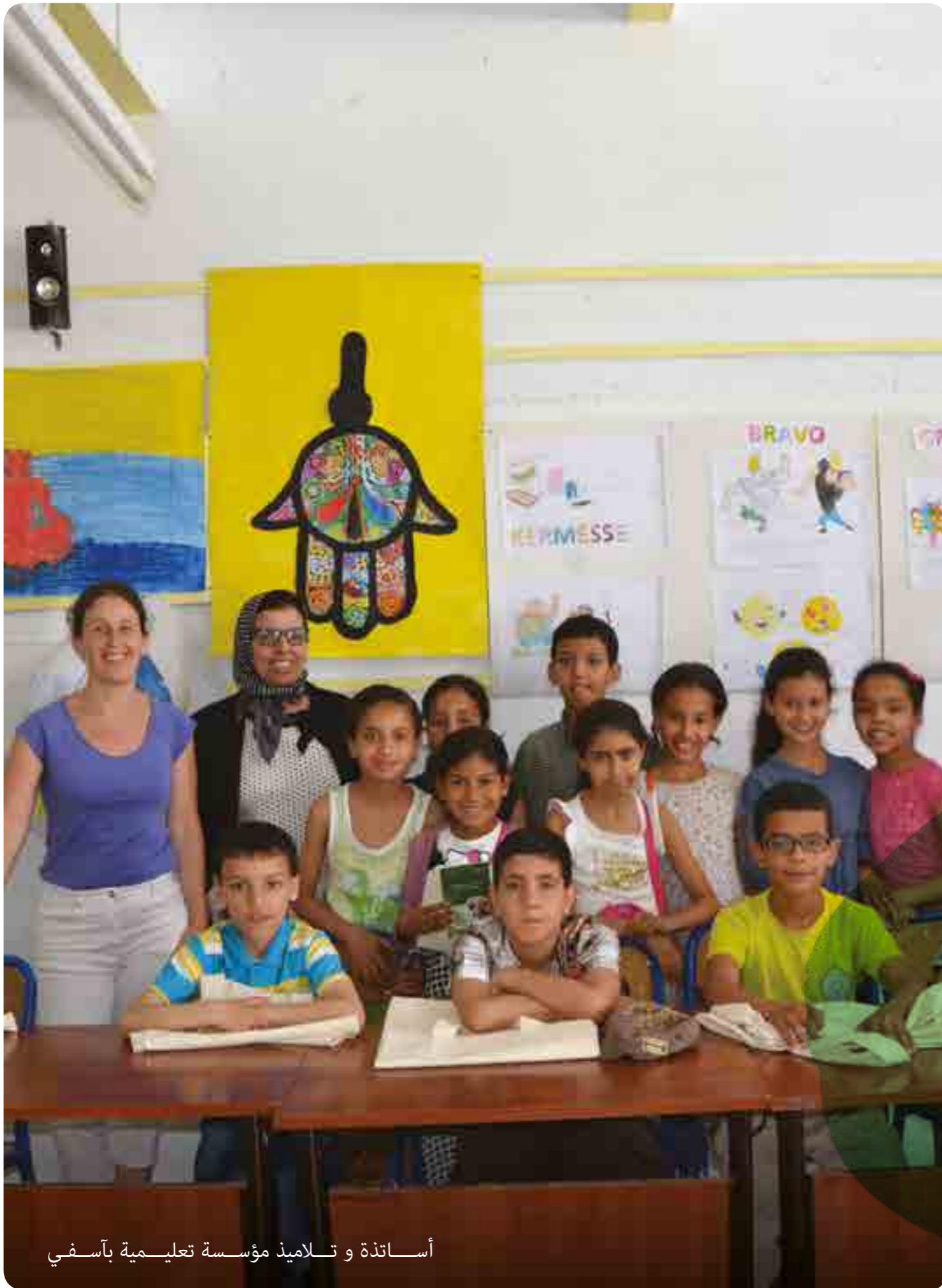
أساتذة و تلاميذ مؤسسة تعليمية بأسفي

الجهات المعنية : بن جرير، الدرالبيضاء، الجديدة، خريبكة، أسفي، اليوسفية وسلا. الساكنة المستهدفة : الشباب والأطفال من الوسط القروي و/أو من فئات إجتماعية محرومة