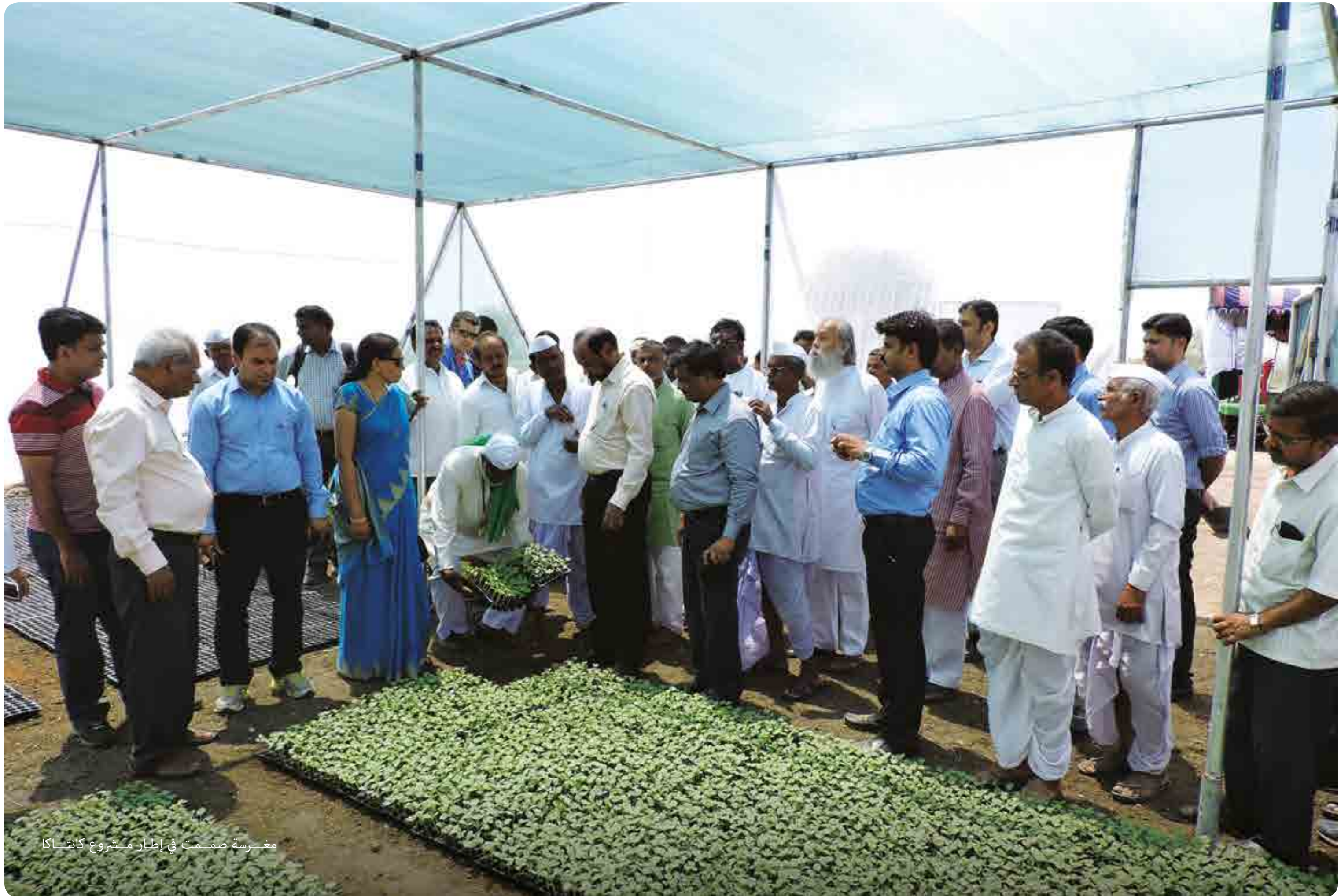
مغرسه صممت في إطار مشروع كاتشاك