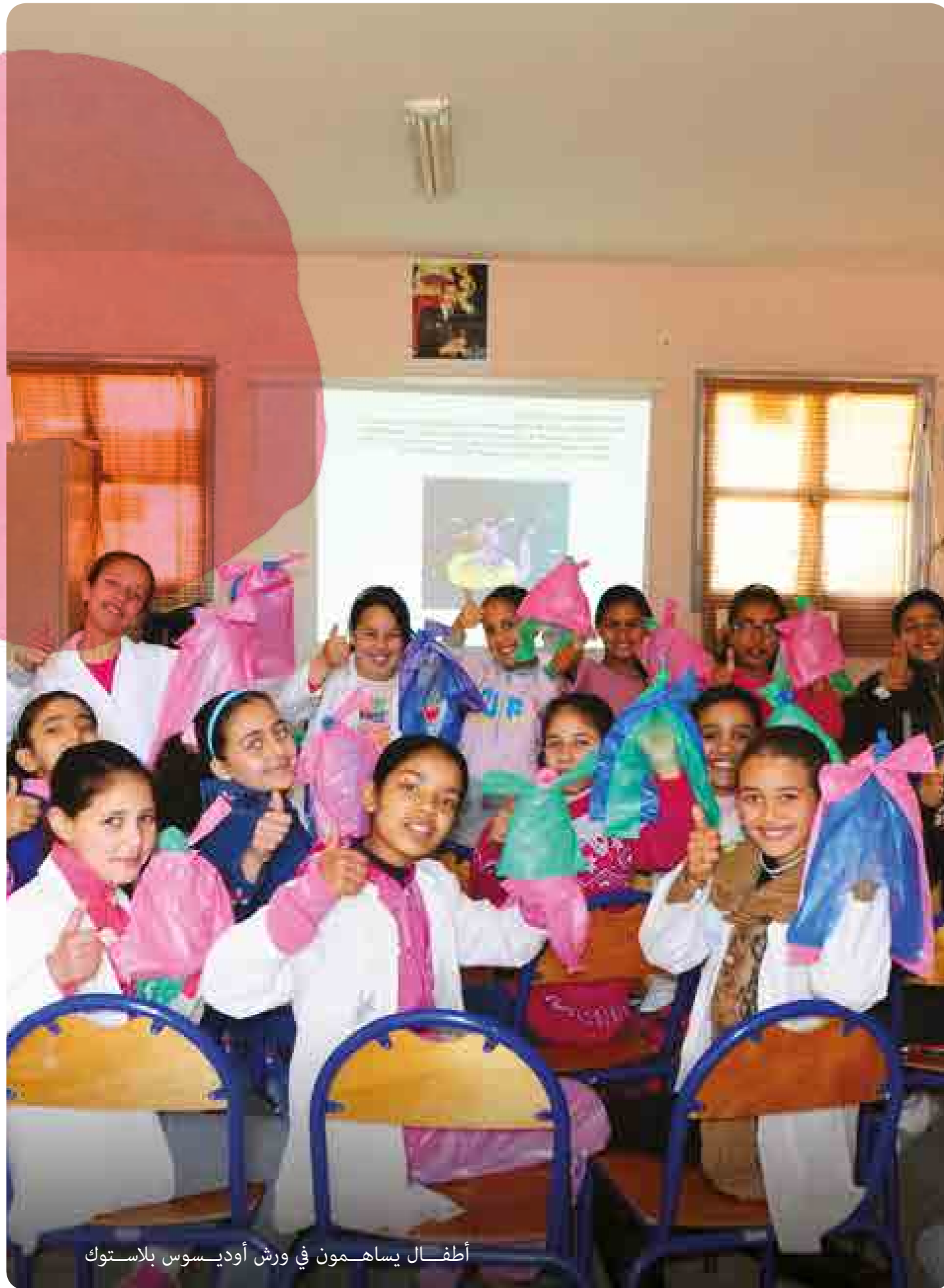
أطفال يساهمون في ورش أوديسوس بلاستوك