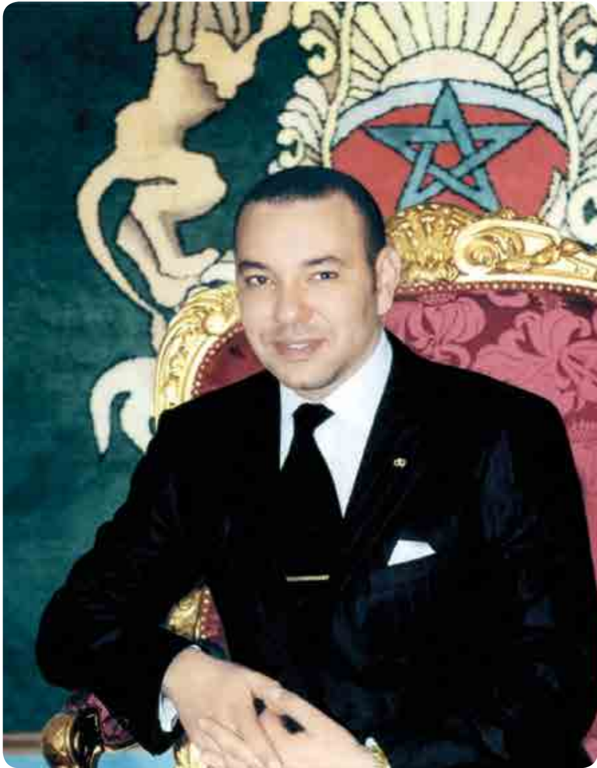
صاحب الجلالة الملك محمد السادس نصره الله