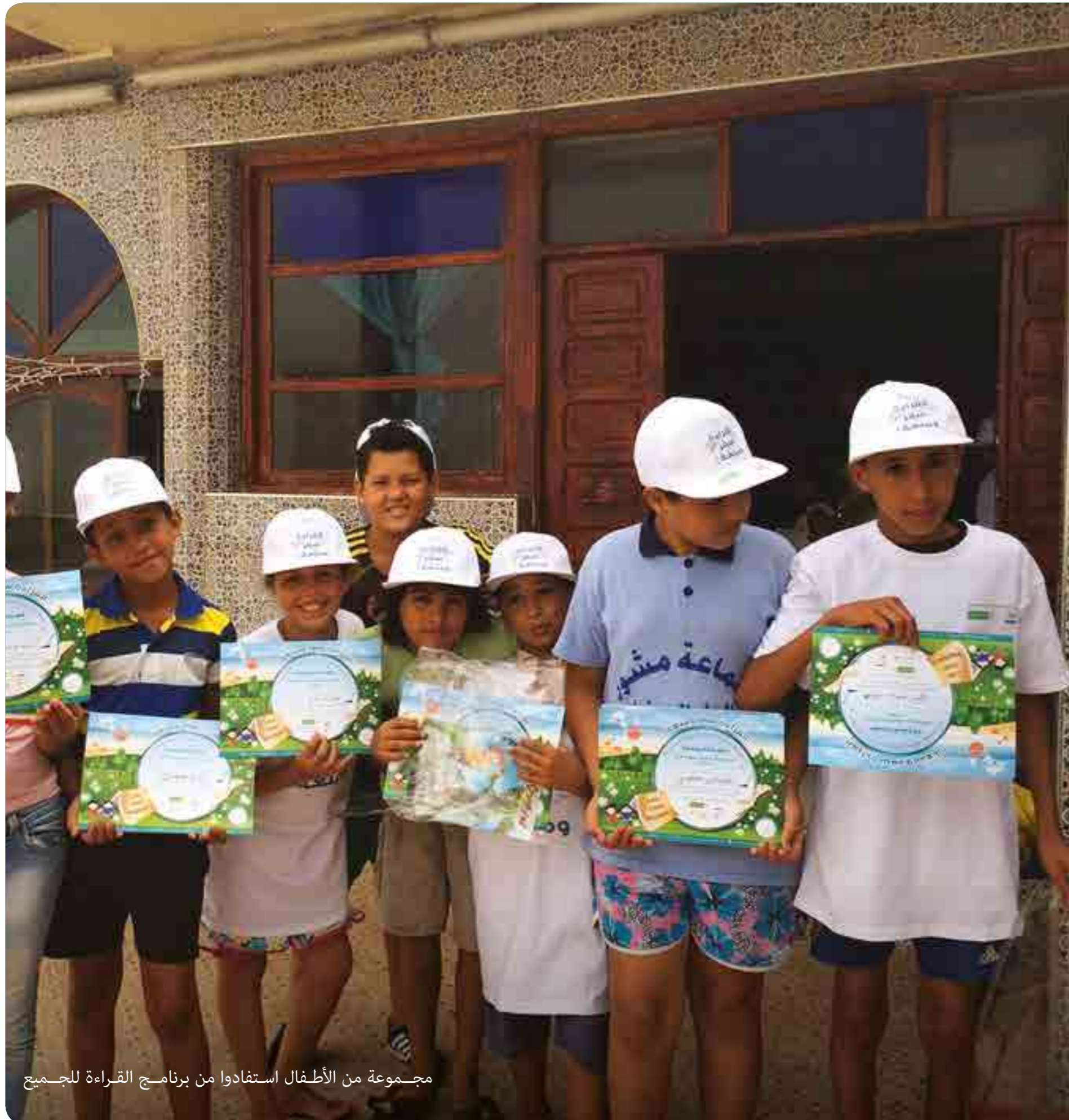
مجموعة من الأطفال استفادوا من برنامج القراءة للجميع

وهكذا، استفاد 11 000 طفل من ورشات يومية للقراءة داخل 20 مركز للاصطياف.