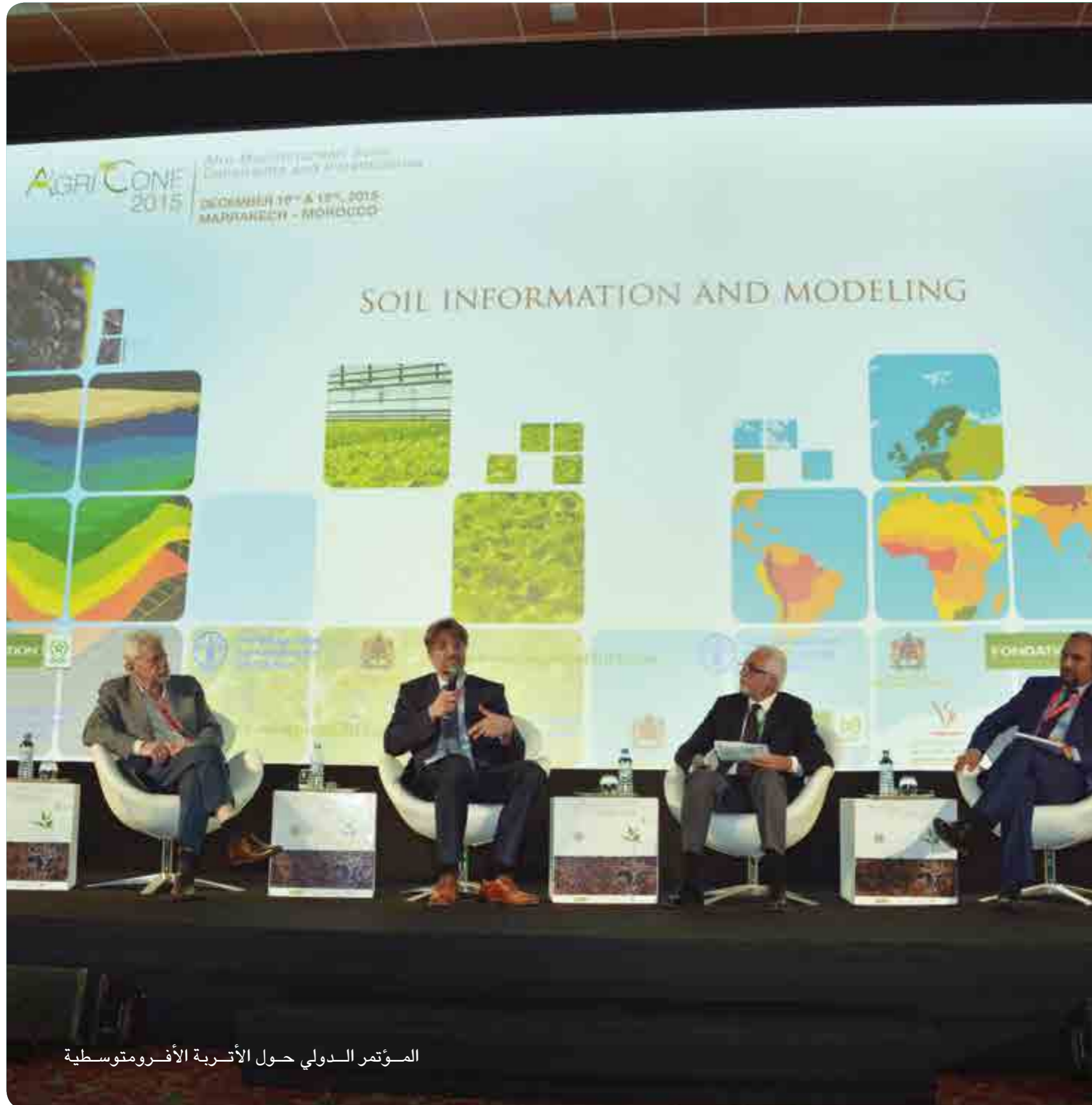
المؤتمر الدولي حول الأتربة الأفرومتوسطية