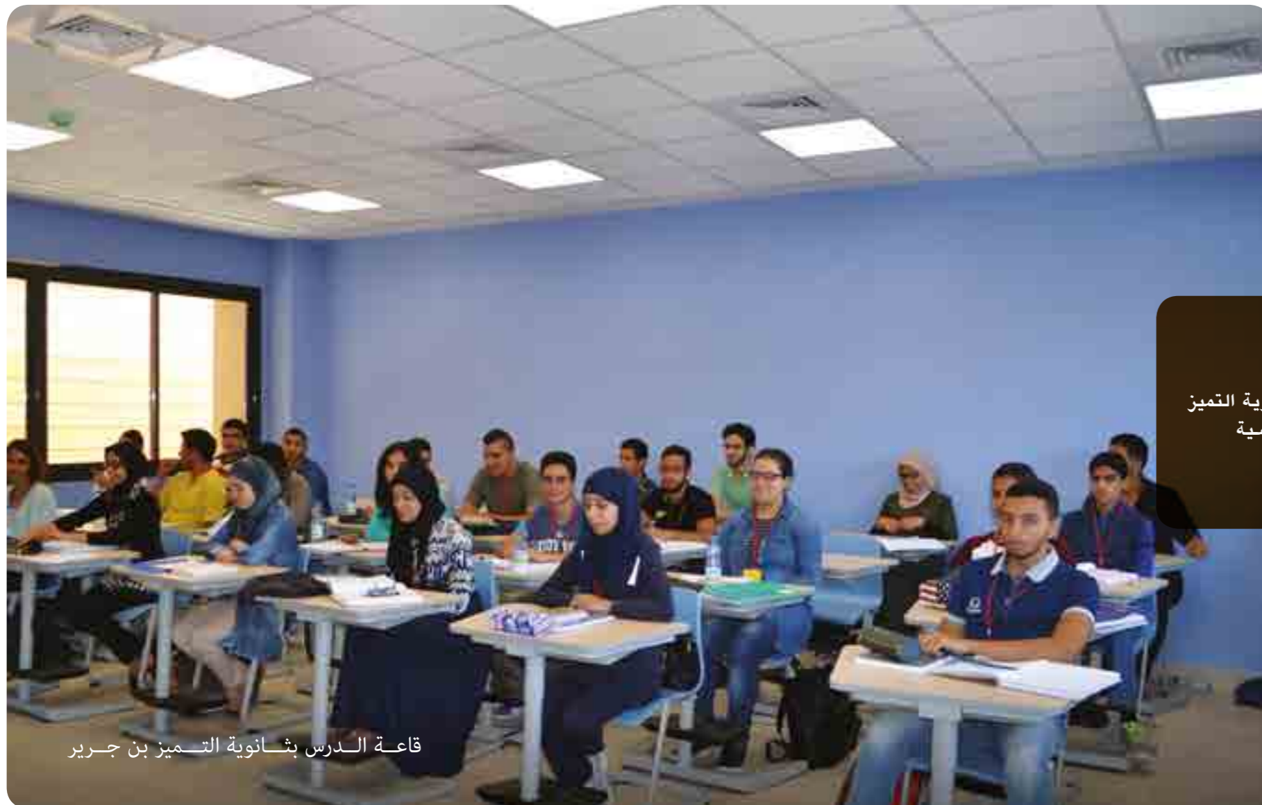
قاعة الدرس بثانوية التميز بن جريير

حصول 83 طالب بثانوية التميز بآبن جريير على منح دراسية