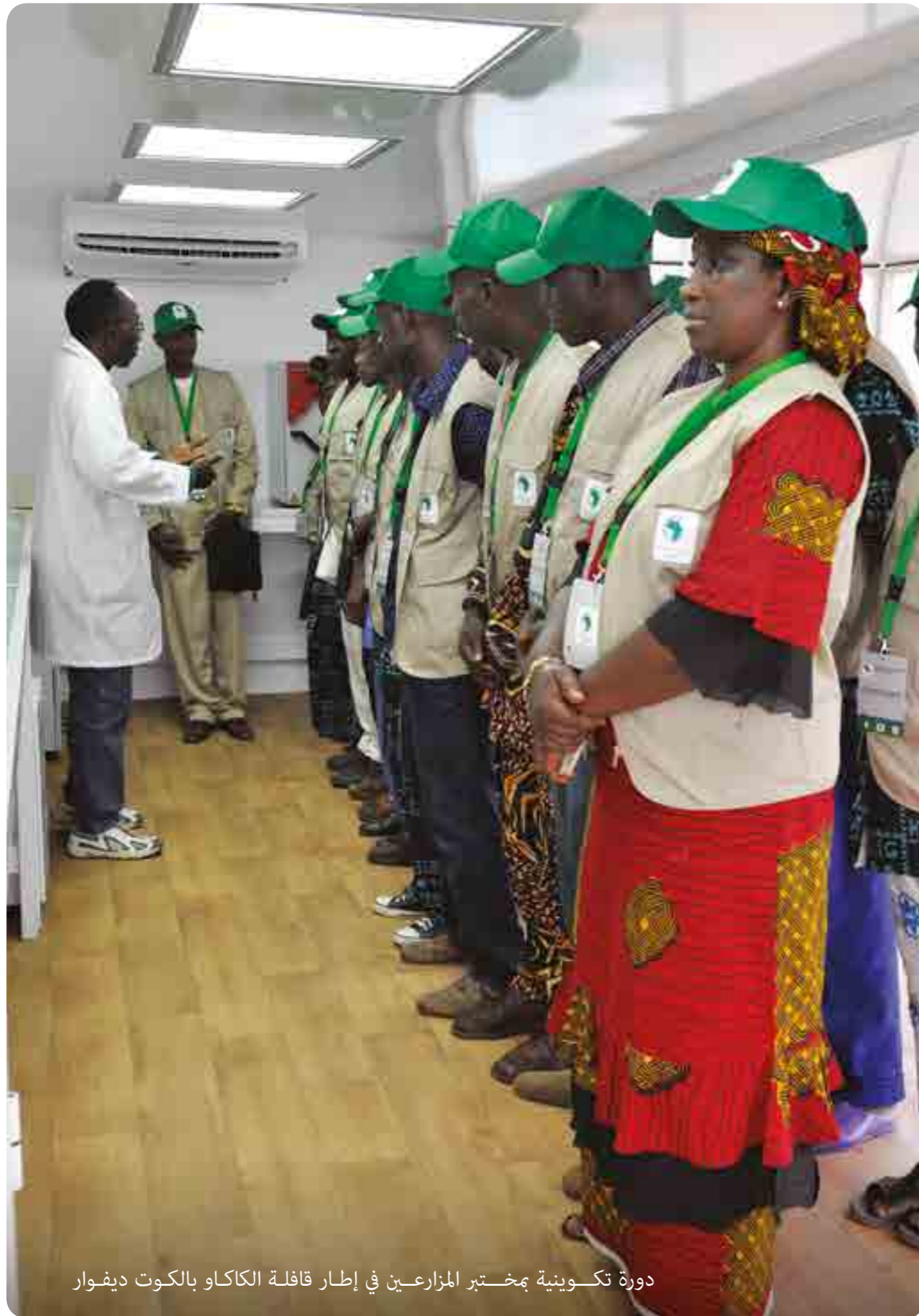
دورة تكوينية بمختبر المزارعين في إطار قافلة الكاكاو بالكوت ديفوار