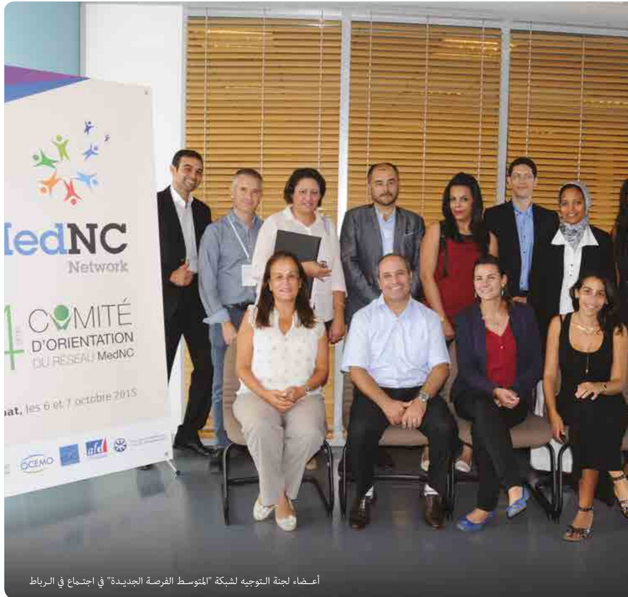
أعضاء لجنة التوجيه لشبكة "المتوسط الفرصة الجديدة" في اجتماع في الرباط