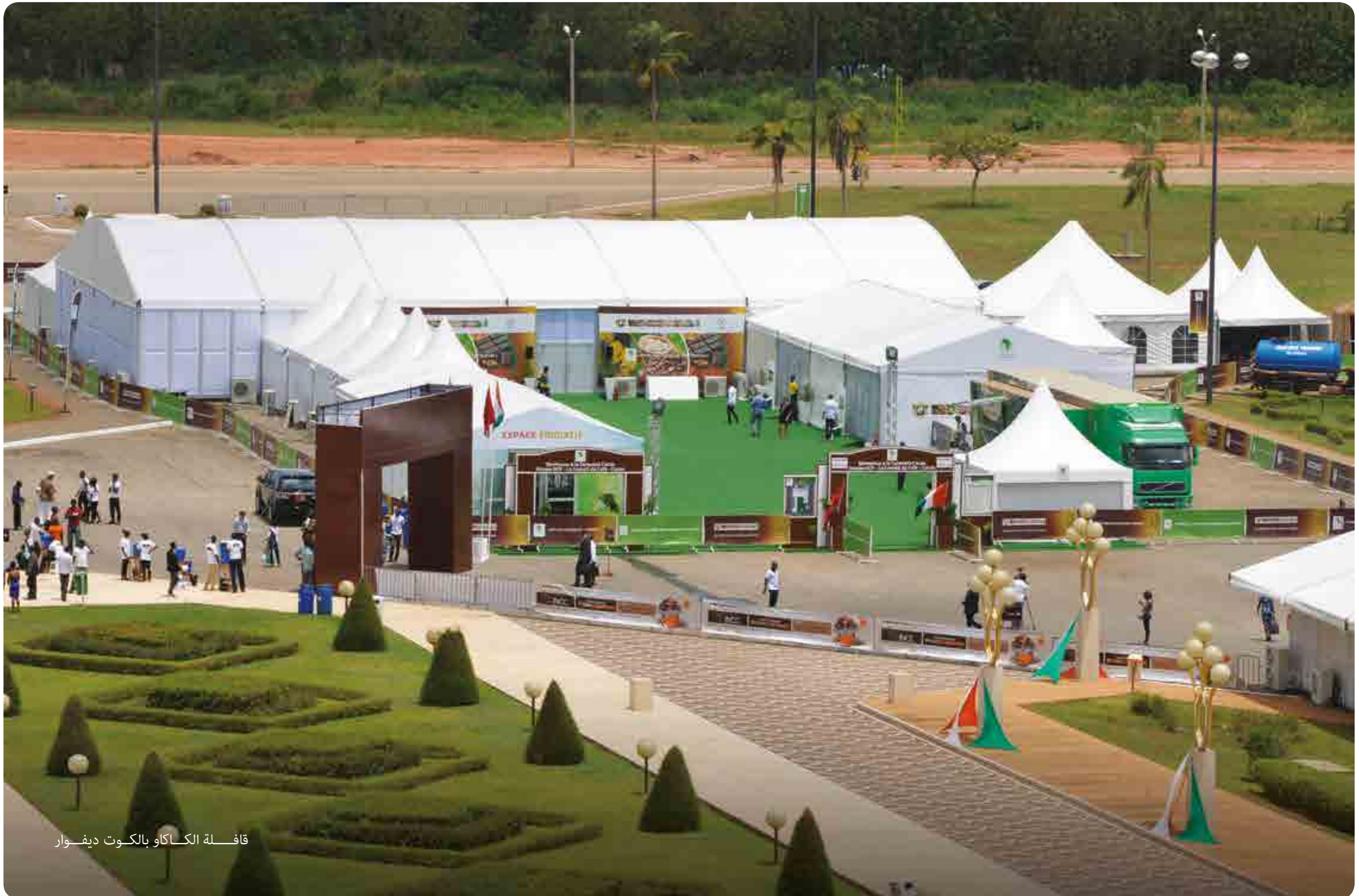
قافلة الكاكو بالكوت ديفوار