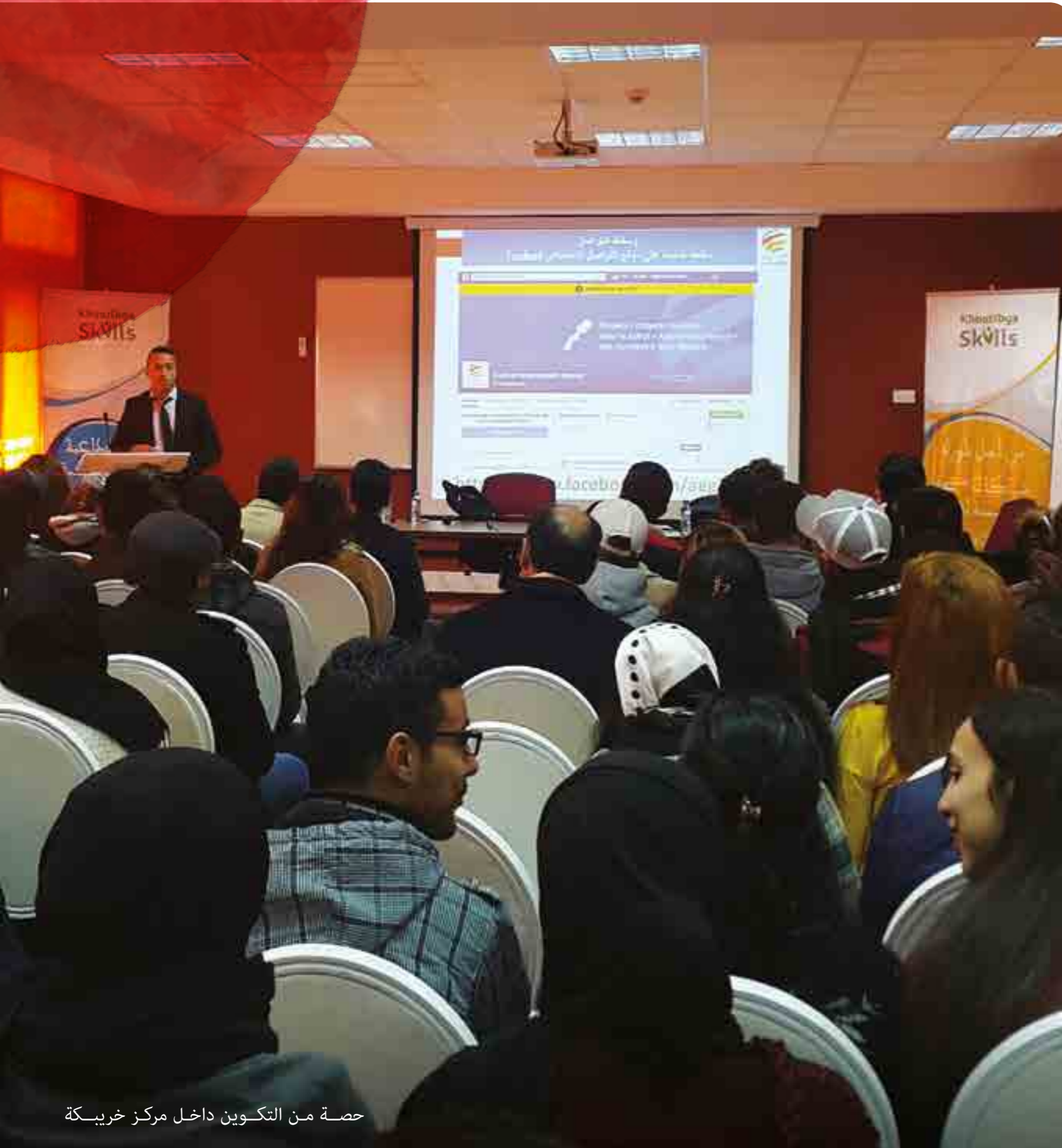
حصة من التكوين داخل مركز خريكة