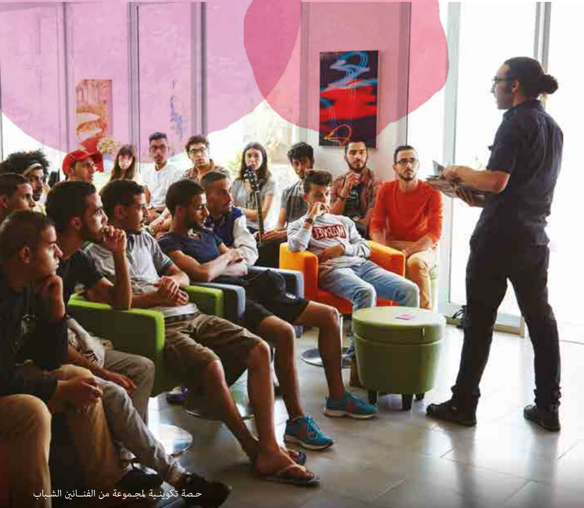
حصة تكوينية لمجموعة من الفنانين الشباب

تتمين التراث الموسيقي المغربي بعد الدعم الذي قدمته مؤسسة OCP لإنتاج مختارات من موسيقى كناوة في سنة 2013، تم دعم مختارات موسيقية أخرى من التراث المغربي في سنة 2015 ويتعلق الأمر بالطرب الغرناطي المغربي و فن العيطة. وتعد الخزانة الموسيقية المغربية إحدى مكونات التراث الثقافي اللامادي. فهي تسمح بالمحافظة على الذاكرة الجماعية ونشرها من خلال التراث الموسيقي لفن العيطة والطرب الغرناطي التي ترمز للتلاقح الموسيقي في العديد من نغماته وتجسد جانبا ثقافيا أصيلا لبلدنا. وستسمح هذه المختارات الموسيقية للأجيال المقبلة بالتعرف على ما يزر به هذا التراث العريق من خلال تنوع مصادره ومنشديه.