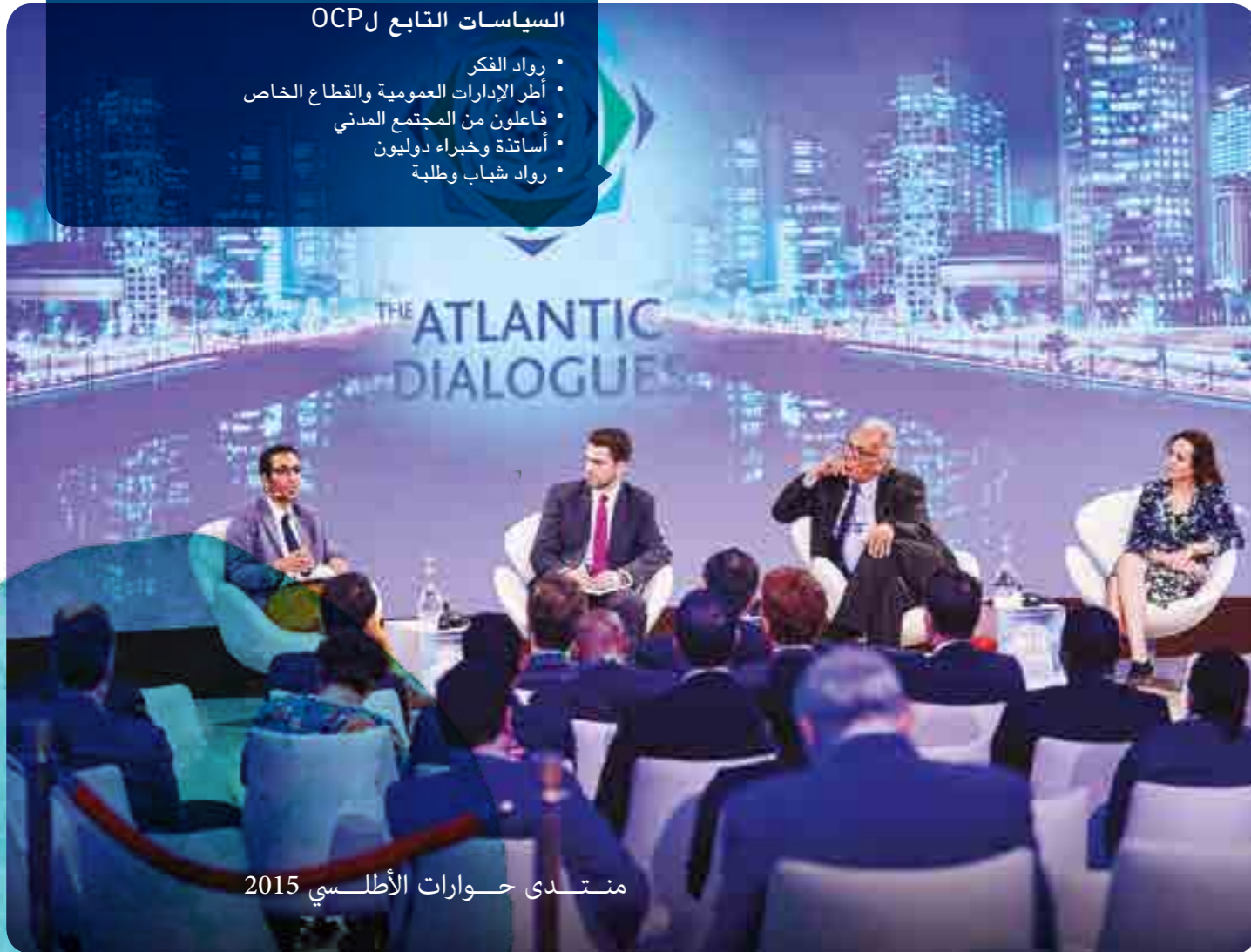
منتدى حوارات الأطلسي 2015